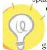
ILLUSTRAZIONE DI FRANCESCA ROSA.

Secondo Od&M — che in www.corriere.it/economia/quantomipagano permette di scoprire se il proprio stipendio è adeguato — altri fattori che influenzano la retribuzione dei giovani ingegneri sono il ruolo